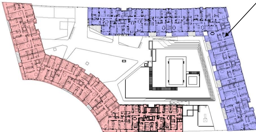
PLANTA 1º - E. 1/300

1. - Reservas Técnicas definitivas (no subsanadas a la fecha del Acta de Recepción): en caso afirmativo: